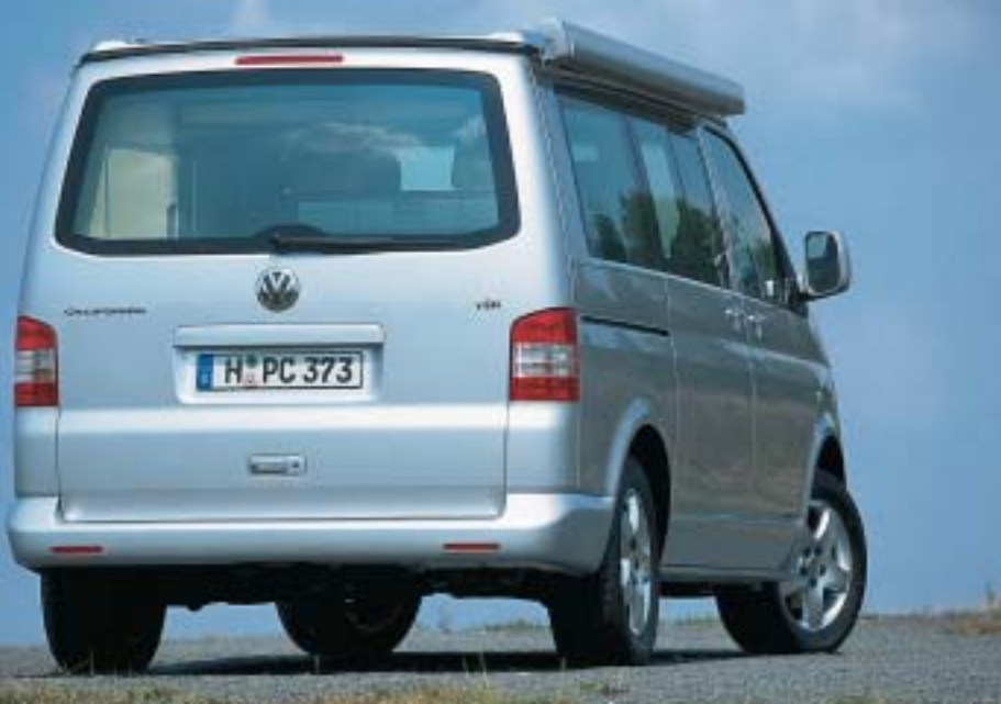
Bullig, sehr dynamisch und als Reisemobil ganz unauffällig: der neue VW California T5.