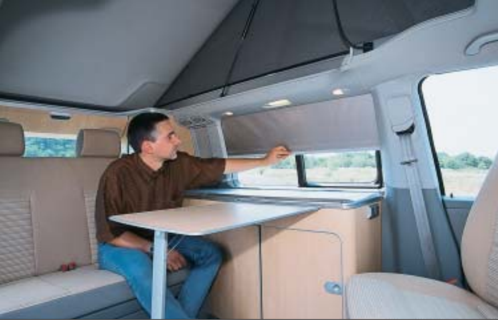
Ein bekannter Grundriss, neue Details: Rollos zur Verdunkelung, Möbel mit Alu-Korpus.

Auch die Sitzbank kennzeichnet nur auf den ersten Blick eine enge Verwandtschaft mit dem Vorgängermöbel. Sie ruht in Schienen aus dem Multivan, verfügt über integrierte Dreipunktgurte. Die Rückenlehne kann in drei Stellungen arretiert werden. Eine große Schublade nimmt Gepäck auf; seitlich ist eine Durchlademöglichkeit vorgesehen. In der Ausstattungsvariante Comfortline klappen die Kopfstützen zum Bettenbau bequem zurück – komfortabler geht's nicht.